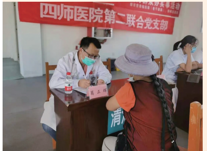
当飞机稳稳地降落在江苏大地时,我的脑海里突然闪回到半年前抵达新疆的那一刻。场景交错间,时光飞逝,岁月如梭,我的援疆之旅自此告一段落,虽然只有短短6个月,但这段宝贵的经历已在我的生命中书写下浓墨重彩、不可磨灭的一笔。还记得那天接到医院通知即将成为镇江市第四批小援疆干部人才开展任务时,我心潮澎湃,激情满怀。临